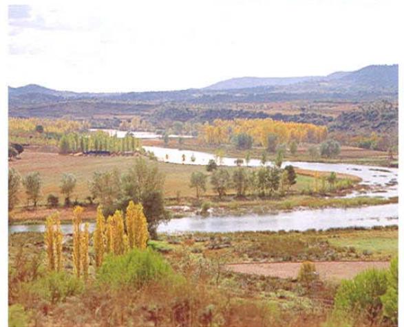
Sacedón. Paisaje del Tajo.

Seguimos ahora hacia el sur bordeando el embalse y llegamos a , situada a orillas del embalse del mismo nombre. Hubo un castillo al norte del que no queda nada en pie.