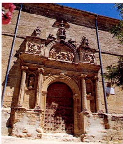
Huete. Iglesia de Santa María de Castejón.

Otros edificios religiosos son la iglesia de Santo Domingo y restos de su convento de los s. XVI y XVII, de estilo herreriano y toda la fábrica es de sillería; la iglesia de Santa María de Castejón y el Convento de Cristo, ostenta una bella portada renacentista atribuida a Berruguete y Vandelvira; el convento de la Meced, con iglesia y claus-