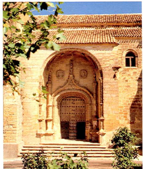
Carrascosa del Campo. Iglesia.

Edita: Junta de Comunidades de Castilla-La Mancha Consejería de Industria y Trabajo Dirección General de Turismo, Comercio y Artesanía EDICIÓN 2001. Texto, diseño y maquetación: Antonio Pareja. © Prohibida la reproducción total o parcial del contenido de esta publicación en soporte alguno sin la preceptiva autorización.