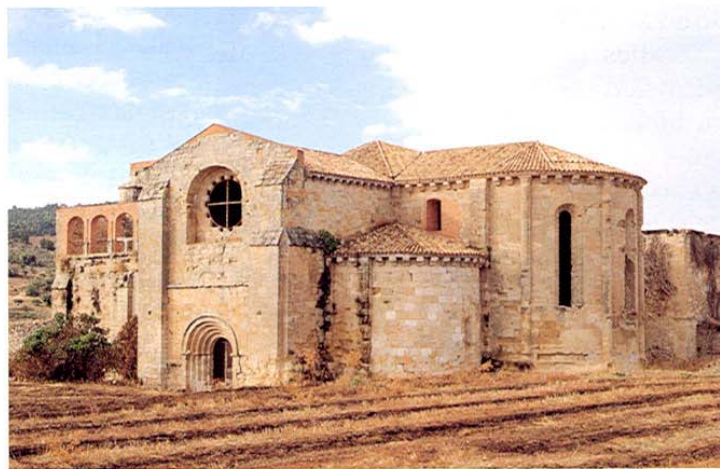
Córcoles. Monasterio de Monsalud.

La iglesia del antiguo convento de las Clarisas es del s. XV y actualmente se utiliza como casa de labranza.