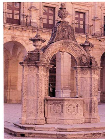
Uclés. Brocal de Aljibe.

En el exterior destacan sus portadas, siendo la más llamativa la principal, una portada churrigueresca atribuida a Pedro de Ribera. En el interior, la sacristía es plateresca, con cubiertas de lacería gótica y el refectorio conserva un magnífico artesanado de 1548 con los bustos de Carlos I y los 36 maestros de la Orden de Santiago. Como curiosidad destaca la cala-