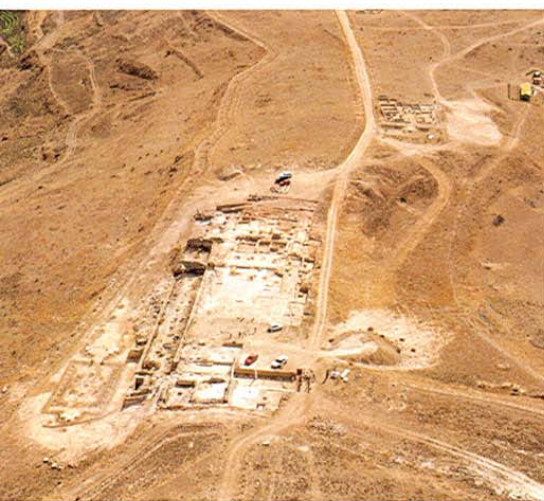
Cañaveruelas. Ruinas de Ercávica.

Y de nuevo a la Alcarria conquense, a CAÑAVERUELAS, situada en las proximidades del embalse de Buendía. Lo más notable es su iglesia parroquial, de finales del s. XVI, con techumbre de madera y un pequeño museo de arte sacro con orfebrería, cantorales, mantos y casullas; otro museo está dedicado a la etnología de la zona.