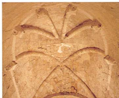
Zorita de los Canes. Bóveda del ábside. Iglesia del Castillo.

Nuestro próximo destino es ALMONACID DE ZORITA , importante conjunto de trazado medieval. En su plaza mayor se conservan los típicos soportales adintelados, un palacio gótico del s.