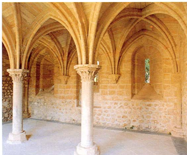
Córcoles. Monasterio de Monsalud. Sala Capitular.

En su caserío destacan algunas casas de los s. XVI-XVIII con escudo en sus portadas. En sus alrededores importantes yacimientos arqueológicos (poblados celtíberos, romanos, visigodos y árabes).