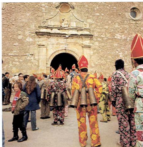
Almonacid del Marquesado. La Endiablada.

Continuaremos la ruta dirigiéndonos a ALMONACID DEL MARQUESADO , donde el 2 y 3 de febrero se celebra la famosa fiesta de La Endiablada en honor de San Blas, inmediatamente después de la Candelaria, una de las fiestas más famosas y de mayor colorido de las que se celebran en la región. Lo más llamativo es la vestimenta de sus danzantes, que portan a la espalda grandes cencerros. Llevan gorros de flores en la Candelaria y de obispo para San Blas. El Diablo Mayor se viste de rojo. Hay que comer y beber de todo; el pueblo invita.