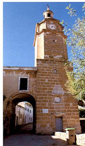
Huete. Torre del Reloj y Arco del Almazán.

Del castillo que se levanta en el cerro que domina la población sólo queda un reconstruido torreón y restos de los silos, aljibes y canalizaciones; del recinto amurallado se conservan el arco de Medina y el arco de Almazán que formaba parte de una de las puertas de la ciudad, anejo a la torre del reloj que pertenecía al antiguo ayuntamiento.