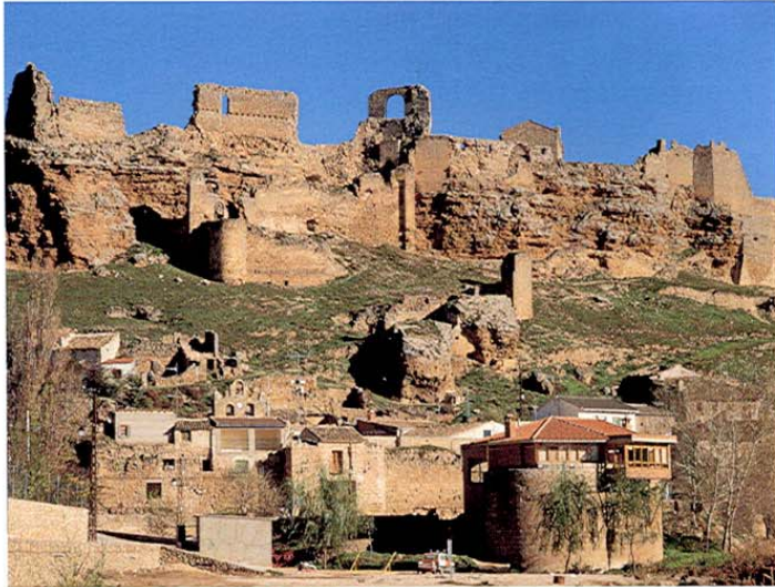
Zorita de los Canes. Pueblo y castillo.

Seguimos camino y, al salir de Barajas de Melo, tendremos que rodear la Sierra de Altomira, la altura más importante de la Alcarria con 1.180 m.