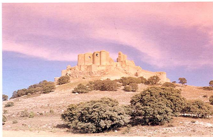
Pueblo de Almenara. Castillo.