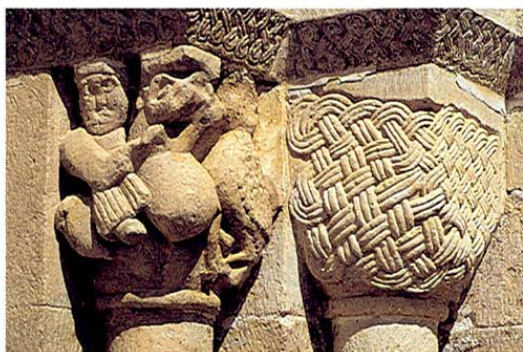
Labros. Iglesia Santiago Apóstol. Detalle capitel.

Y ahora, a recorrer el Valle del Mesa, interesantísimo rincón de la provincia de Guadalajara, un espacio natural de gran interés para los amantes de las actividades relacionadas con la naturaleza. En MOCHALES tomaremos contacto con el río y con la hoz que continuará hacia Villel de Mesa. Aquí dan comienzo varias rutas de cicloturismo y senderismo que van unas en dirección a Turmiel, y otras hacia Villel de Mesa.