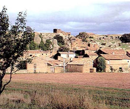
Rueda de la Sierra.

En un pequeño cerro, a la entrada del pueblo y cerca del río Piedra, se encuentran los restos de la fortaleza construida en el s. XIV. Defensa de la frontera, fue incendiada en 1710 por las tropas vencidas en Villaviciosa y conserva muralla, tres grandes cubos esquineros y las ruinas de la torre del homenaje de unos doce metros de altura.