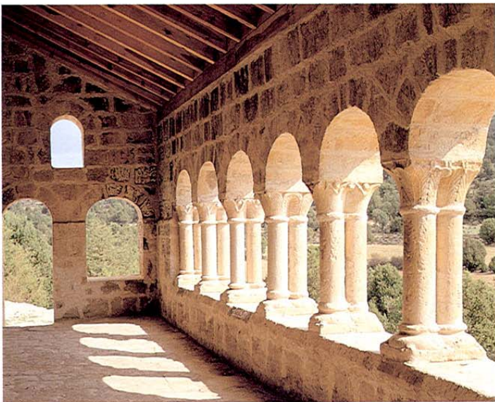
Hinojosa. Ermita de Santa Catalina. Detalle canecillos. Pórtico.

Y ahora regresamos por la CM-2107 hacia el cruce de Labros; un desvío nos lleva a la Ermita de Santa Catalina, una