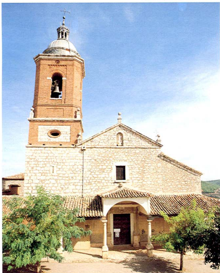
Iglesia parroquial. Horche.

Antes de llegar a Guadalajara, el último desvío es esta vez para visitar LUPIANA. De gran interés es el monasterio de San Bartolomé, declarado monumento, en 1931. Es un complejo recinto monasterial fundado por la primera Casa Jerónima en España en 1370. Su claustro principal es una de las joyas del plateresco, debido a Covarrubias. Posee, además, iglesia conventual, sacristía, un claustro gótico y jardines. Ha sido recientemente restaurado, es de propiedad privada y su visita muy restringida. De este monasterio procede la estatua sepulcral de doña Aldonza de Mendoza, gótica de 1440, expuesta en el Museo Provincial de Guadalajara.