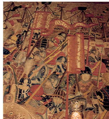
Tapiz de Pastrana.

Otros edificios religiosos son el convento de San José, fundado por Santa Teresa y la Princesa de Éboli en el s. XVI, rodeado por una hermosa huer-