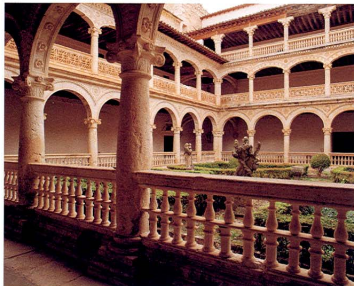
Claustro Monasterio. Lupiana.

La población cuenta en sus calles con las típicas casasonas alcarreñas. De la iglesia parroquial de San Pedro, de finales del XV y principios del XVI, destaca la portada sur, plateresca, y la torre del XVII, con dos cuerpos. En la Plaza Mayor podemos contemplar el rollo de la villa y el Ayuntamiento.