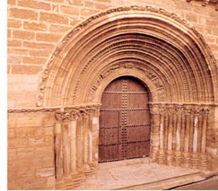
Cifuentes. Puerta de Santiago.

Esta población cuenta con una rica gastronomía y unos vinos excepcionales. Tiene gran interés la celebración de la Semana Santa, el Domingo de Resurrección cuelgan al Judas entre dos balcones, bajo él pasa la procesión y los mozos le disparan con escopetas. Para San Isidro se bendicen pan y huevos y se reparten entre la gente, y el segundo domingo de septiembre se celebra el Cristo de la Misericordia, con encierros y corridas de toros.