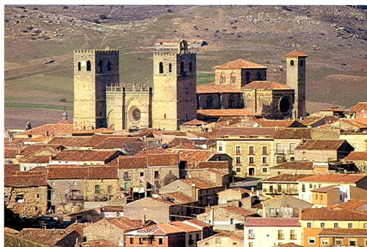
Sigüenza. Catedral y conjunto urbano.

Magníficamente conservada pese a los avatares de la historia, nos muestra una ciudad alta de carácter medieval en la que destaca el castillo (actual Parador de Turismo), construido tras la invasión árabe en el s. VIII, época en la que esta población adquirió gran importancia estratégica y se construyó la alcazaba; y la ciudad baja, renacentista y barroca que tiene su principal