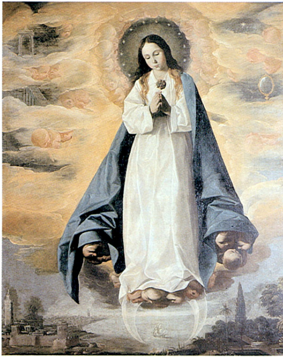
Inmaculada Niña. Zurbarán. Museo Diocesano.

arqueología celtibérica, esculturas románicas, góticas y renacentistas, importantes retablos, piezas de orfebrería y una colección de pintura con obras como la Inmaculada Niña de Zurbarán.