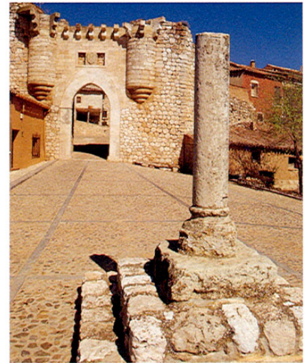
< Hita. Vista panorámica. Rollo y Puerta de Hita.

Foto fortada: Portada del Palacio de Cogolludo.