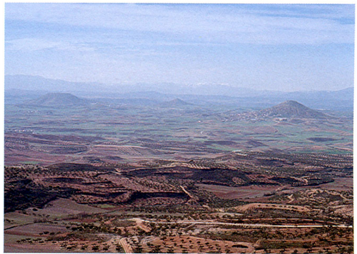
Vista panorámica desde Trijueque.

El edificio de mayor interés es el castillo; lo que queda de él es del s. XVI, recientemente reconstruido. Se ha instalado un museo dedicado a la obra de Camilo José Cela Viaje a la Alcarria .