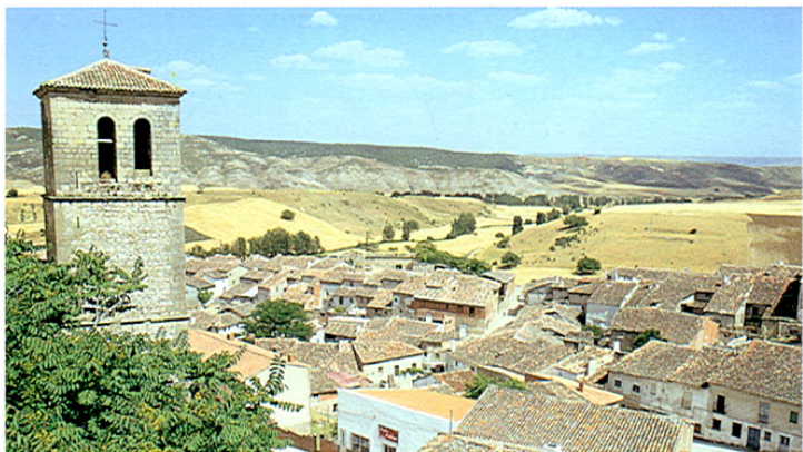
Cogolludo. Vista parcial y torre de la Iglesia de San Pedro.

Ducal, importante edificio del primer renacimiento español. Obra de Lorenzo Vázquez, con fachada almohadillada y una cornisa de dentellones. Bella portada con escudo ducal y, en el interior, patio plateresco, buenos artesanos en algunas estancias y una chimenea gótico-mudéjar. Está declarado monumento desde 1931.