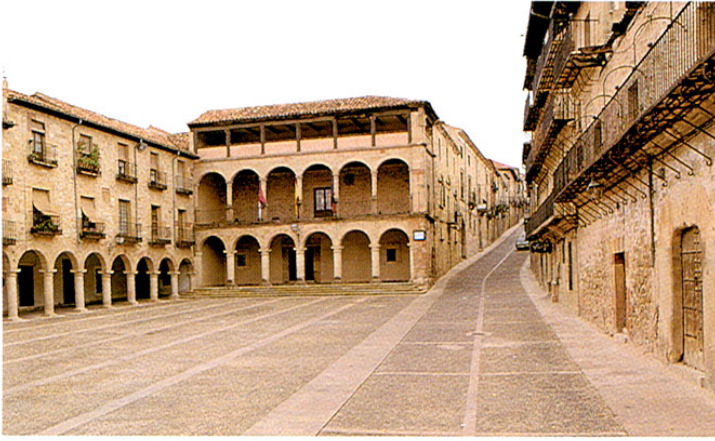
Sigüenza. Plaza Mayor.

símbolo en su catedral, amén de un tejido urbano en el que se respira un ambiente medieval, con diferentes estilos, muy interesantes, que albergó hasta finales del s. XVIII a la universidad.