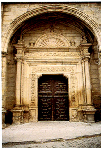
Almorox. Iglesia parroquial.

Nuestra próxima visita será ESCALONA , situada en una meseta, sobre una escarpada ladera a la margen derecha del río Alberche. Dominaba la meseta uno de los