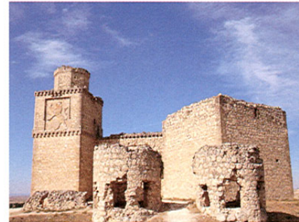
Castillo de Barcience.

Edita: Junta de Comunidades de Castilla-La Mancha Consejería de Industria y Trabajo Dirección General de Turismo, Comercio y Artesanía EDICIÓN 2001.