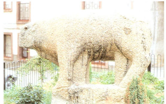
Castillo de Bayuela. Toro ibérico.

Salimos a la N-V para dirigirnos a Talavera de la Reina, final de nuestra ruta aunque previamente, si nos gustan los deportes acuáticos, podremos acercarnos al embalse de Cazalegas en el río Alberche.