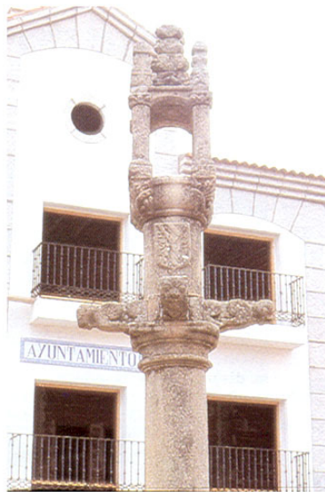
Castillo de Bayuela. Rollo.

De aquí nos desplazamos hasta HINOJOSA DE SAN VICENTE , villa fundada en el s. XVI, fue aldea de Castillo de Bayuela hasta 1632 en que Felipe IV le concedió el villazgo. Su conjunto urbano es el típico serrano con casas adaptadas a la topografía, calles de trazado irregular, y en el que destaca su iglesia parroquial del s. XVI de transición del gótico al renacimiento. La fuente del s. XVII que for-