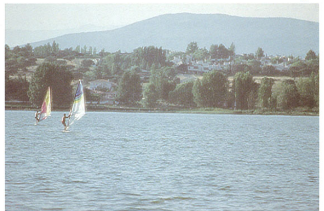
Embalse de Cazalegas

Muy cerca se encuentra SARTAJADA , donde sigue funcionando un tradicional alfar, famoso por sus cántaros.