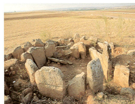
Dolmen de Azután

A las afueras del pueblo, a escasa distancia por la carretera comarcal 701, nos encontramos con el citado Dolmen de Azután, construcción megalítica del tipo de corredor. Muy cerca, en una ampliación de la carretera, se ha encontrado recientemente una serie de enterramientos de época visigoda. Y a 8 km, en el término de Navalmorelejo, se encuentran los