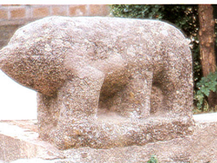
Torralba de Oropesa. Verraco.

Los bordados de Navalcán son los que conservan las raíces más antiguas de todos los bordados toledanos, pudiéndoseles identificar con el punto de Almoraján o Almoxafán ; son muy famosas sus gorgeras ejecutadas del revés del tejido para que el dibujo quede al exterior. Son dibujos muy parecidos a los que se realizan en Israel, Siria, Persia o el Norte de África.