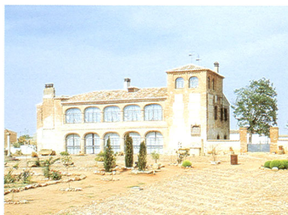
Calera y Chozas. Casa de las Tórtolas.

Y regresamos a Talavera de la Reina, desde donde podremos emprender nuevas rutas que nos adentren en el conocimiento de Castilla-La Mancha.