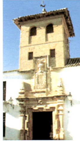
Santa Cruz de la Zarza. Casa del Gallo.

Continuamos ruta hasta VILLAMAYOR DE SANTIAGO , otra población de la Mancha conquense que cuenta con un gran número de palacios y casas señoriales que provienen de la concentración de comendadores de la Orden de Santiago que habitaron aquí en los ss. XVI y XVII. Estuvo amurallada en su