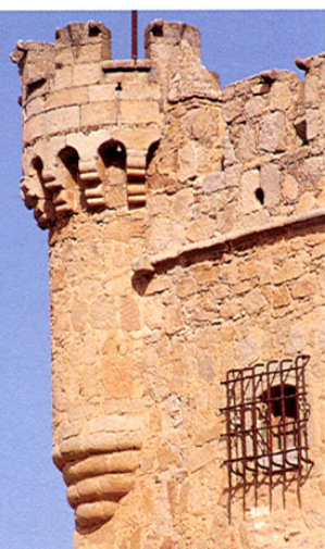
Orgaz Torreón del castillo.

Su castillo, construido en el s. XII y remodelado en los ss. XIV-XV, está muy bien conservado. En la Guerra de las Comunidades fue incendiado por las tropas del Emperador pues en él se refugiaron los vecinos partidarios de los comuneros. La planta es un cuadrado tan sólo roto por una torre y el ábside semicircular de una capilla. En las esquinas y en el centro de uno de los muros hay garitas voladas, semicirculares con modillones y saeteras. La puerta de acceso es de un arco de medio punto adovelado y enmarcado por columna con un escudo sobre la clave.