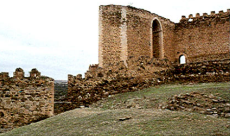
San Martín de Montalbán. Castillo.

Esta fortaleza tuvo varias etapas en su construcción: la estructura básica es de los siglos XII y XIII, las torres albarranas del XIV y la cerca del pozo y la barrera sobre el mismo del XV.