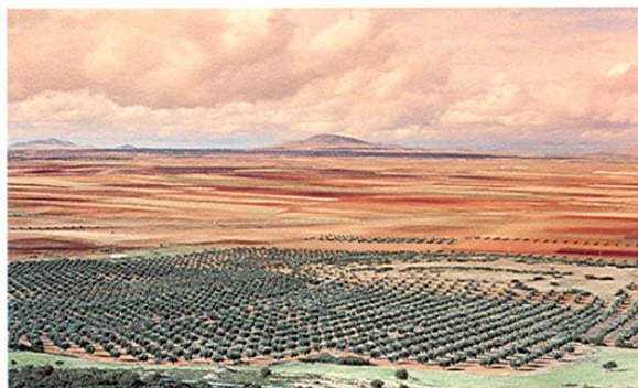
Vista desde la Sierra de Los Yébenes.

restos. En las proximidades se encuentra, en la finca de los Quintos de Mora, el Museo de la Caza.