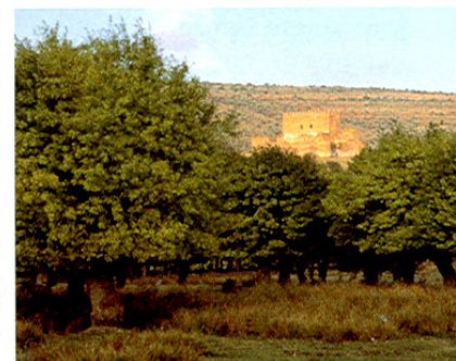
Castillo de Guadalerzas.

A 8 km se encuentra el cruce de la N-401, rodeado de fincas de reses bravas; a pocos metros del cruce, a la derecha, en dirección a Los Yébenes, en una de estas fincas, podemos ver el castillo de las Guadalerzas. En el desfiladero se encuentran los restos de dos castillos. Uno de ellos musulmán, que sirvió de defensa de este paso desde tierras toledanas a Andalucía; y de él sólo puede verse su planta rectangular con una posible torre más grande que el resto. Todas las torres son de planta cuadrada. El castillo cristiano fue cedido por Alfonso VI a la Orden de San Juan y posteriormente a los Calatravos, como hospital para las tres órdenes militares que señoreaban la zona. Sufrió modificaciones en los ss. XV y XVI en las que se reformó la cerca y se levantaron las torres cilíndricas de los ángulos. Conserva casi intacto todo su almenaje. Felipe II se lo vendió al Cardenal Silíceo, quien lo convirtió en colegio de doncellas nobles. Tuvo también capilla, construida en 1769 y de la que quedan algunos