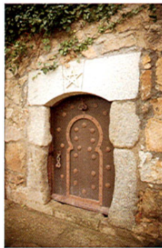
Mascaraque. Acceso al castillo.

Tras 5 km llegamos a la pequeña población de MASCARAQUE cuyo origen se remonta a los tiempos de la dominación árabe, época en que se construyó el castillo que sería luego del comunero Juan de Padilla, pasando después a los duques de Abrantes. Se utilizó para defender al pueblo frente a una incursión carlista en el s. XIX. Está ubicado junto a la iglesia parroquial del s. XVIII, es de planta rectangular con torres cilíndricas. Se conservan del edificio original la torre del homenaje y parte del lienzo norte, resto de otras tres torres redondas en las esquinas y un cuerpo cuadrangular hasta media altura. Ha sufrido hace poco una restauración de gusto dudoso, colocándole estrellas de cinco puntas so-