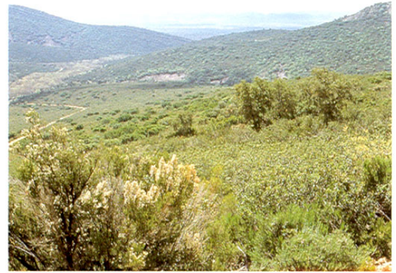
Hontanar. Torre de Malamoneda.

carnos hasta el Boquerón del Estena, donde el río corre entre farallones cuarcíticos. En los alrededores de la población podemos encontrar gran cantidad de fósiles a todos los niveles del terreno.