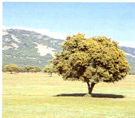
Parque de Cabañeros

Es un extenso espacio natural, declarado parque natural en 1988 y parque nacional en 1995. Es la mejor y más extensa representación del bosque mediterráneo ibérico, con una enorme variedad de especies vegetales. Cuenta con 40.000 Ha actualmente protegidas. El inter-