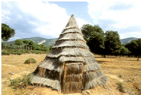
Vista de Cabañeros

Nos dirigimos ahora a ALCOBA para acercarnos a la Laguna Grande, un buen paraje de grullas invernales. Seguimos hasta Santa Quiteria para ir en dirección a Pueblonuevo del Bullaque y pasar por una espléndida