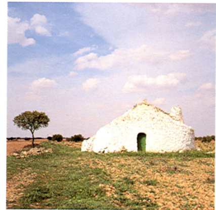
Argamasilla de Alba. Bombo manchego.

La población alcanzó su apogeo en el s. XVI y XVII. Aquí, en la Cueva del Medrano, parece ser que Cervantes, estando preso, dio comienzo a El Quijote . Situada en una esquina, en el centro de la población, tiene una sola planta y cueva en dos niveles, a la que se accede por el patio. Fue declarada monumento en 1972. Otro edificio significativo es la popular casa del Bachiller Sansón Carrasco. De notable interés es la iglesia parroquial de San Juan Bautista, obra del s. XVI con algunas capillas laterales del XVII.