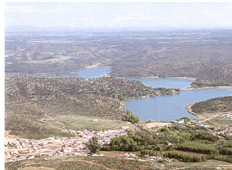
^Lagunas de Ruidera

Lo realmente importantes es haber llegado a una de las zonas lacustres más espectaculares de la Península Ibérica. Además de las dos lagunas citadas, hacia arriba se encuentran La Colgada (mitad en la provincia de Ciudad Real, mitad en la de Albacete), Batana y Salvadora , Lengua , Redondilla , San Pedro , Tinaja , Tomilla , Conceja y La Blanca . Hacia Peñarroya, La Coladilla y la del Cenagal . Este conjunto de las lagu-