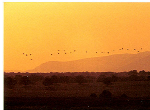
Vista aérea de las Tablas