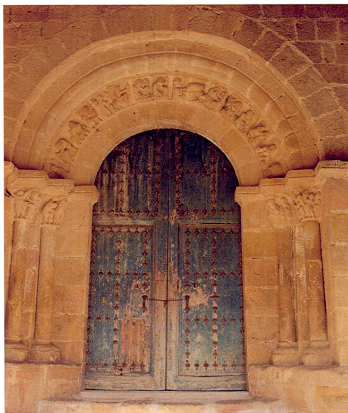
Beleña de Sorbe. Iglesia. Portada

Después de atravesar la populosa HUMANES nos dirigiremos por una carretera local a PUEBLA DE BELEÑA , última población de la vega del Henares, antesala de la zona de los pueblos de la Arquitectura Negra.