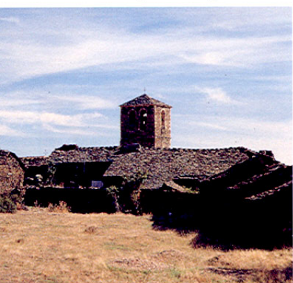
Campillo de Ranas.

En la misma falda del Ocejón, a 1.182 m., rodeado de bellísimos paisajes, regado por el río Jaramilla, MAJAEIRAYO es uno de los puntos de mayor encanto de esta ruta, tanto por