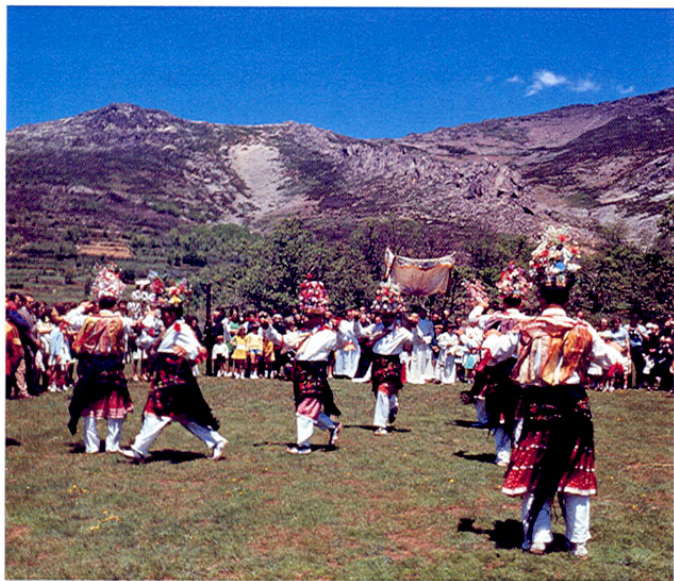
Valverde de los Arroyos. Danzas del Santísimo.

pizarra y madera y destacando su Plaza Mayor, una de las más bellas y cuidadas de la comarca, y la singularidad de sus balconadas en madera adornadas con tiestos de flores. Para poder dominar este conjunto, pues el pueblo está en cuesta, hay que situarse en lo alto de la calle de Enmedio y contemplar el panorama de las casonas, la iglesia, la plaza con su fuente... Para admirar su paisaje, ascender hasta las eras, lugar de gran tradición, donde se celebran las Danzas del Santísimo en la octava del Corpus, fiestas declaradas de interés turístico. Por otro lado, la naturaleza nos ofrece aquí unos paisajes realmente excepcionales, como la Cascada de las Chorreras, de Despeñalagua , con más de 120 m. de caída, a tan solo media hora del pueblo; este mismo camino conduce al Ocejón.