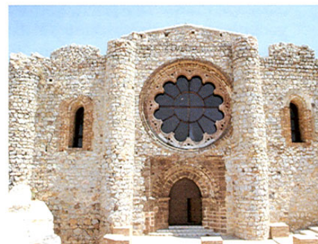
Calatrava La Nueva. Castillo.

Retornaremos a Calzada para tomar la carretera que conduce a Almagro; en las inmediaciones de GRANÁTULA DE CALATRAVA se encuentra el volcán de Columba . Granátula es un pequeño pueblo lleno de encanto, fundamental para estudiar la cultura romana. En sus alrededores estuvo emplazada la ciudad de Oretum , una de las tres ciudades más importantes de la Oretania romana. El cerro de Oreto, sobre el río Jabalón, goza de una excepcional situación pues domina una amplia zona del valle y los caminos hacia Andalucía. Otro punto de excavaciones es el Cerro de los Obispos; ambos establecen una etapa cultural que va del Bronce ibérico a la Edad Media.