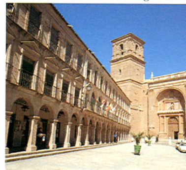
Villanueva de los Infantes. Iglesia de San Andrés y Ayuntamiento.

En torno a la calle Cervantes hay una serie de casonas y palacios de interés: el cuartel de los Caballeros de Santiago, la del Marqués de Melgarejo, del s. XVII, que guarda una interesante pintura de Carreño; el Palacio de los Bustos, del s. XVI, con magnífico patio y portada y la del Caballero del Verde Gabán, personaje citado por Cervantes en El Quijote . Muchas más iglesias y casas solariegas nos iremos encontrando al pasear por las calles