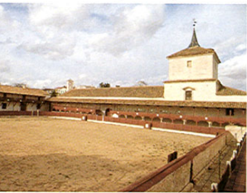
Santa Cruz de Mudela. Plaza de Toros Las Virtudes

Por TORRENEUVA , población cercana al río Jabalón y en la que destaca su iglesia parroquial de Santiago el Mayor, del s. XVI, gótica isabelina, con una magnífica portada y un retablo gótico en el interior; la ermita del Santo Cristo, del s. XVII, algunas casas interesantes del XIX y, en la carretera que va a Valdepeñas, el Santuario de N a S a de la Cabeza, patrona de la villa, llegamos a SANTA CRUZ DE MUDELA , población muy visitada por sus balnearios, importante zona de caza de perdiz roja e interesante enclave artesano. Cuenta con un patrimonio arquitectónico cuyo edificio de mayor interés es la iglesia parroquial de N a S a de la Asunción, gótica del s. XVI con elementos renacentistas, donde destacan sus portadas. La iglesia de San José es neogótica y el convento de las Concepcionistas de estilo historicista. No deje de visitar las fábricas artesanas de cuchillería y navajas.