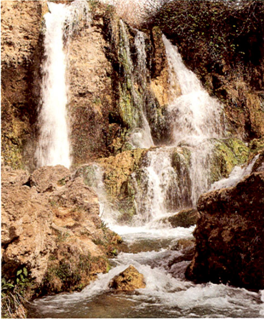
Ruidera. Cascada del Hundimiento.

y su carácter popular la plaza de toros y el molino de la Bella Quiteria, éste convertido en pequeño museo etnológico que nos muestra una típica cocina manchega con todos sus enseres en la planta baja.