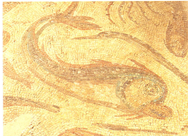
Balazote. Mosaico del Pez. (Museo de Albacete)

Esta población fue la Balat Al-Suf de época musulmana y la Baladazot de la cristiana. Se encuentra en el punto donde se unen la llanura de la Mancha con los comienzos de la Sierra de Alcaraz. Lo más significativo que conserva es la parroquia de N a S a del Rosario, construcción del s. XVI, que tiene un artesonado mudéjar. El presbiterio está presidido por un retablo barroco del s. XVII que procede del Convento de las Francisca-