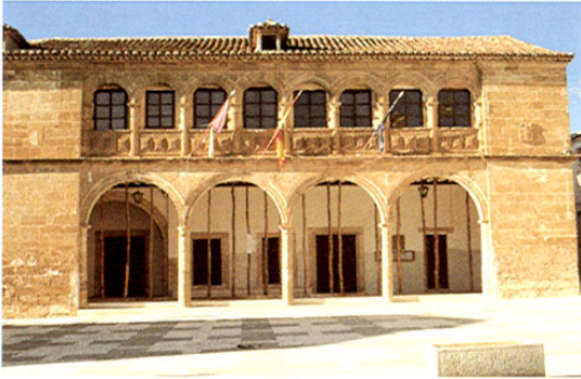
El Bonillo. Plaza del Ayuntamiento.

villa. De esa época es el sencillo rollo que se conserva en las afueras y el Ayuntamiento, un edificio de doble planta con dos arquerías, ocho en la superior y cuatro en la baja formando soportales; sufrió un ampliación en el siglo XVIII, con portada adintelada sobre pilastras toscanas. Junto a la Plaza Mayor se encuentra la iglesia parroquial de Santa Catalina, obra del s. XVIII, construida sobre otra anterior del s. XVI. En esta iglesia es muy venerado el Cristo de los Milagros, de poética tradición del s. XVII. En la torre presenta una ventana plateresca y una escalera de caracol; cuenta con un interesante retablo barroco del s. XVIII, y un museo que entre otras maravillas, exhibe un Cristo con la Cruz a Cuestas de El Greco, un cuadro de Vicente López relativo a los milagros del Cristo, y un San Vicente atribuido a Ribera.