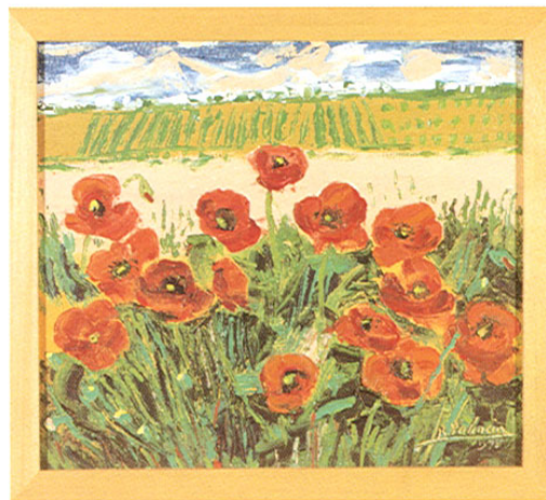
Paisaje. Benjamín Palencia.

de fuego de sus fiestas; unos hombres, dentro de unas estructuras rodantes, que emulan el cuerpo de un toro y con fuegos artificiales, corren por las calles provocando carreras y sustos entre los asistentes a la fiesta.