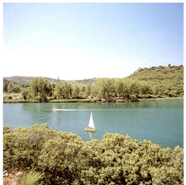
Ossa de Montiel. Lagunas.

Regresamos a Ossa de Montiel para dirigirnos a EL BONILLO , población que perteneció a la jurisdicción de Alcaraz hasta que en 1538 adquirió la condición de