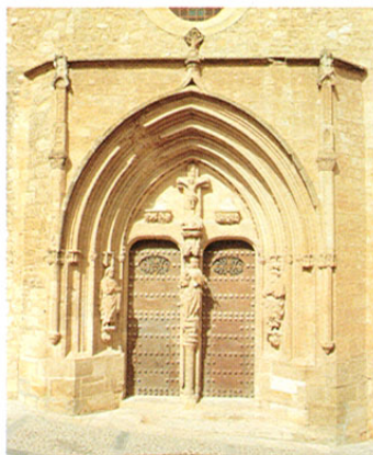
Chinchilla. Iglesia de la Santa María.

del homenaje que volaron los franceses en la Guerra de la Independencia. En ella estuvo cautivo César Borgia, condenado por el asesinato del Duque de Gandía.