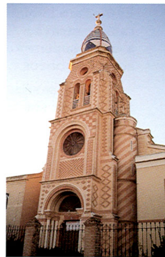
Caudete. Iglesia de San Francisco.

Regresamos a Almansa para desde allí proseguir la ruta en dirección a ALPERA , situada en un lugar privilegiado en un valle al abrigo de varias sierras supe-