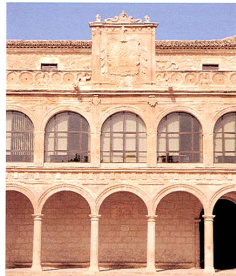
San Clemente. Fachada Ayuntamiento.

Destacan también la Torre Vieja, del s. XV, el Arco de la Inquisición, los dos puentes sobre el río Rus, y a unos 9 km se encuentra el Santuario de Nuestra Señora de Rus; muy reformado, su arquitectura es del s. XVII, siendo un centro romero de gran importancia en la comarca. El Domingo de Resurrección, los jóvenes pujan en la plaza gran cantidad de dinero para poder llevar las andas de la Virgen; recogen la Virgen de los Remedios en la iglesia parroquial y la llevan en frenética carrera al santuario de la Virgen de Rus, recogiendo a ésta también a la carrera y llevándola a la parroquial; el Domingo de Pentecostés, devuelven cada una a su sitio, celebrando el Baile de la Virgen tras las carreras.