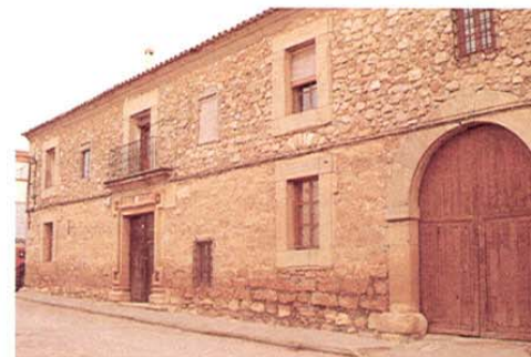
Las Pedroñeras. Casa solariega.

Su casco antiguo en forma de almendra y que conserva claras e importantes muestras de la arquitectura popular manchega, está considerado como el mejor de la comarca manchega conquense. Sus calles invitan a un sugerente y atractivo paseo en el que encontraremos grandes casonas muy bien cuidadas, como la casa palacio de los Molina, del s. XVIII, la Casa de Mendizábal, la Casa del Curato, la Posada, la antigua residencia de Jesuitas, del s. XVI y hoy sede de los