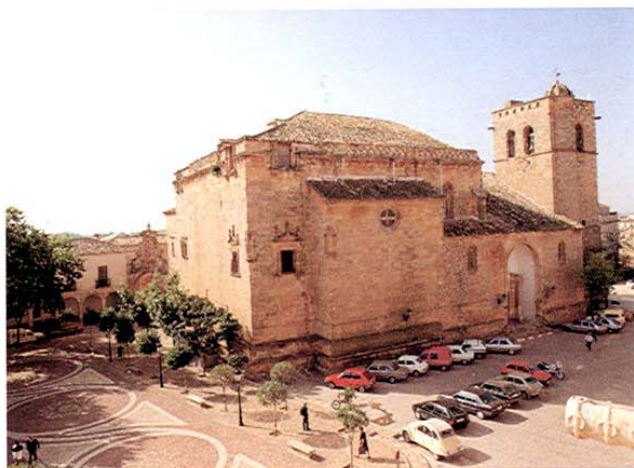
San Clemente. Plaza Mayor e Iglesia de Santiago.

Plaza Mayor y otra por la Plaza de la Iglesia. Muy decorado su interior, cuenta con varias capillas laterales y en el altar mayor una magnífica cruz gótica de alabastro proveniente de la ermita de la Cruz Cerrada, además de varios retablos.