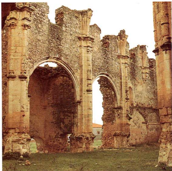
Villaescusa de Haro. Restos del Convento de los Dominicos.

Conserva ejemplos de importantes construcciones como la iglesia parroquial de San Pedro, cuya primitiva fábrica es de los ss. XIII y XIV, con reformas del XVI-XVII. De estilo gótico tardío, con desarrollo posterior renacentista, destacan la portada renacentista, el ábside y, sobre todo, la capilla de la Asunción, levantada en 1507 por Diego Ramírez de Fuenleal para enterramiento de su familia, de estilo gótico isabelino, con una espectacular bóveda estrellada y un bellissimo retablo de transición del gótico al renacimiento, rematado por un baldaquino y decorado con hermosas tallas en madera policromada.