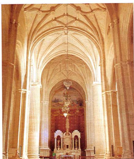
San Clemente. Iglesia de Santiago.

término se han encontrado restos de construcciones romanas, fue fundada en el s. XII y convertida en villa por los Reyes Católicos. Perteneció a las Órdenes Militares como punto defensivo contra los árabes en la frontera castellana.