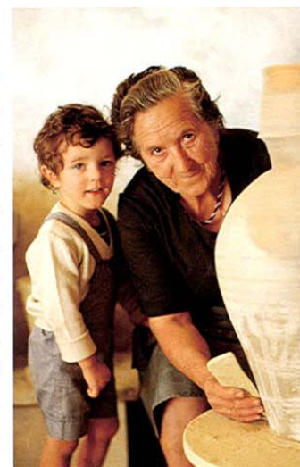
Mota del Cuervo. Cantarera.

Nuestro próximo destino es BELMONTE , villa natal de Fray Luis de León. Es un conjunto monu-