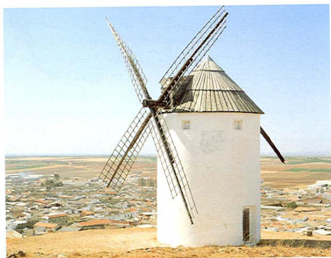
^El Pedernoso. Casa solariega.

Y llegamos a la importante villa manchega de MOTA DEL CUERVO , de gran influencia comarcal, con un notable grupo de siete molinos de viento. Éstos, junto con los de poblaciones como Campo de Criptana y Consuegra, dan la típica imagen de la Mancha de Don Quijote .