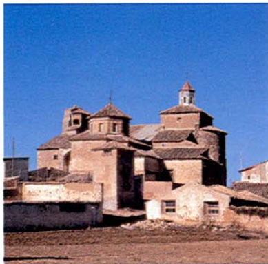
Valverde del Júcar.

Nos dirigimos hacia Alarcón pero antes tomemos el desvío que sale a la izquierda y nos acercamos a BARCHÍN DEL HOYO , típico pueblo de la Manchuela, en el que destaca la iglesia parroquial de la Asunción, con un magnífico patrimonio mueble en el interior, y una casa-palacio del s. XVI. Sobre un cerro, en la parte oriental, hay restos de un castillo árabe y en el paraje conocido como Rincón de San Miguel , se encuentra el yacimiento arqueológico Fuente de la Mota,