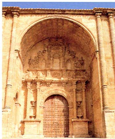
Iglesia de Santa María. Alarcón.

Salimos a la N-III y nos dirigimos a MOTILLA DEL PALANCAR , población en la que podemos ver la Casa de los Luján del s. XVII con magnífi-