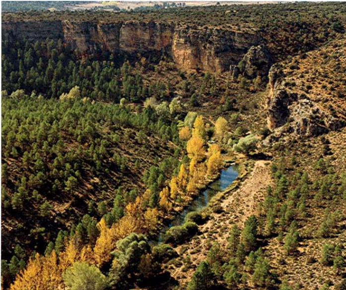
Hoces del Cabriel.

carretera, pasa por la Posada de Contreras y por un camino junto al río llega hasta una zona en que el estrechamiento de las rocas forma las curiosas siluetas llamadas Los Cuchillos . Aguas abajo, en una zona bastante inaccesible, se encuentran las pinturas rupestres de la hoz de San Vicente.