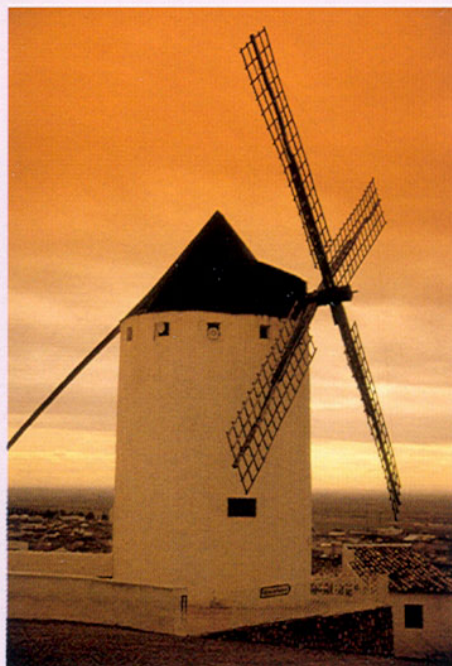
Molino. Campo de Criptana.

Los siglos de hegemonía del califato de Córdoba son tranquilos en esta zona, pero a partir del XII la presión cristiana comienza su avance desde Toledo hacia el Sur. En 1147 Alfonso VII conquista el castillo de Calatrava, repuebla esta zona y le concede fuero regio. Poco después, en 1158, Raimundo de Fítero y otros compañeros fundan la Orden Militar de Calatrava, siguiendo el modelo del Císter francés. Esta Orden acabaría controlando en ese siglo y los siguientes la inmensa mayoría de la provincia, desde Villarrubia de los Ojos o Malagón, al Norte, hasta Almuradiel, ya en Sierra Morena.