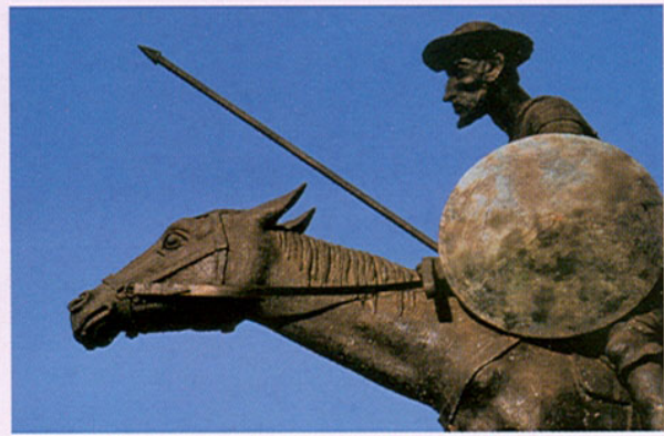
Monumento a D. Quijote. Alcázar de San Juan.

Los siglos siguientes (XIV y XV) se desarrollan entre la repoblación de un lado y los enfrentamientos entre la nobleza, las Ordenes militares y la Corona. Con la consolidación política que significa la unificación de los Reyes Católicos, Ciudad Real verá como se le confirman los privilegios de la Hermandad Vieja (1475), se crea una sede de la Inquisición (1483) aunque de vida efímera, y se funda una Chancillería (1494) que estará aquí durante once años para ser luego trasladada a Granada.